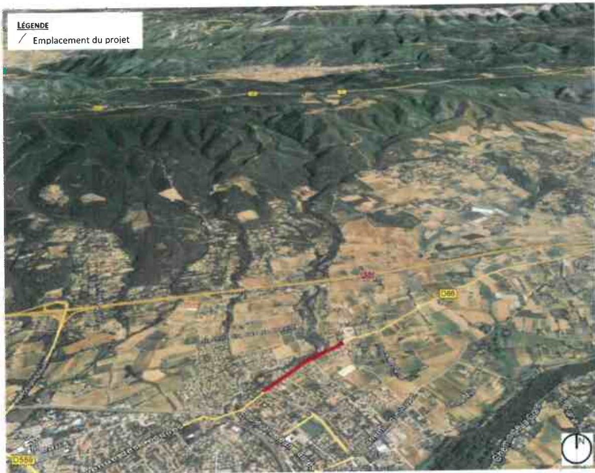
PHOTOGRAPHIE AÉRIENNE DU SITE