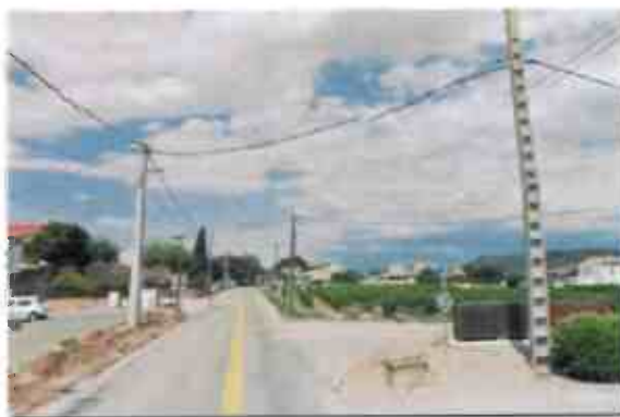
RD66 au droit du carrefour RD66 / ch. des Bastidons