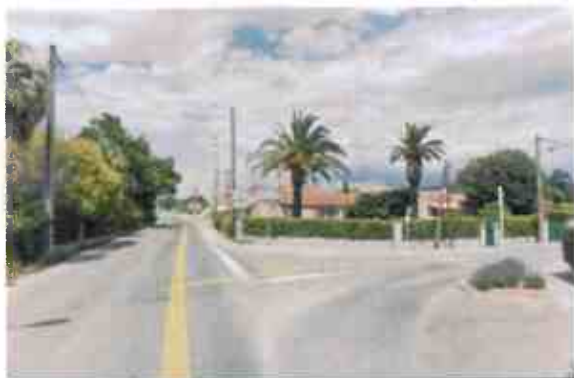
Vue du carrefour RD66 / Bd Ventre