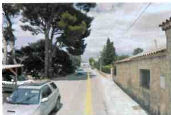
RD66 au niveau des Samats