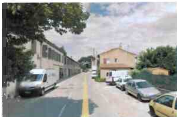
Rétrécissement de la RD66 au niveau de la Miolane