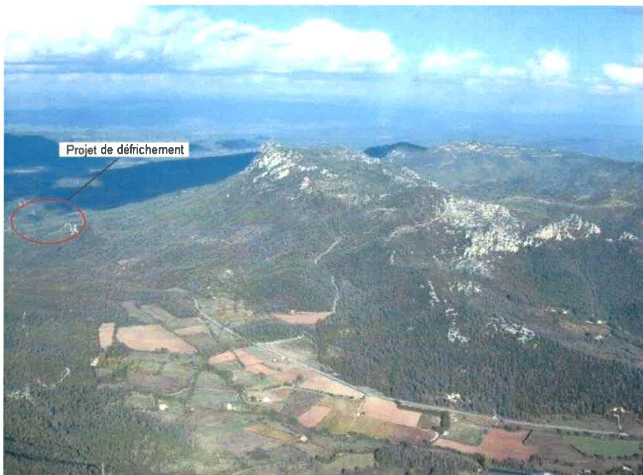
Vue externe de la zone à défricher depuis le nord

- Annexe 3 : Prises de vues de la zone à défricher -