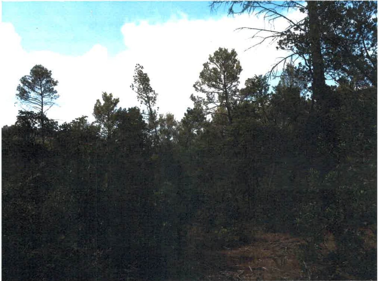
Vue interne de la parcelle - Photo n°1 (cf annexe 4, carte de localisation)