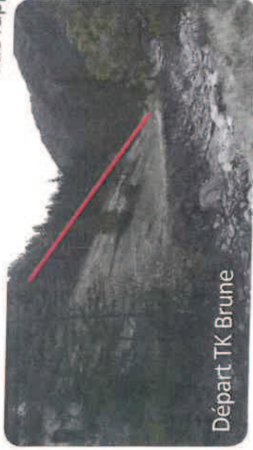
Vue rapprochée TK