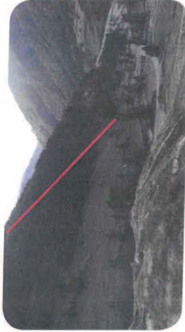
Vue éloignée TK Brune