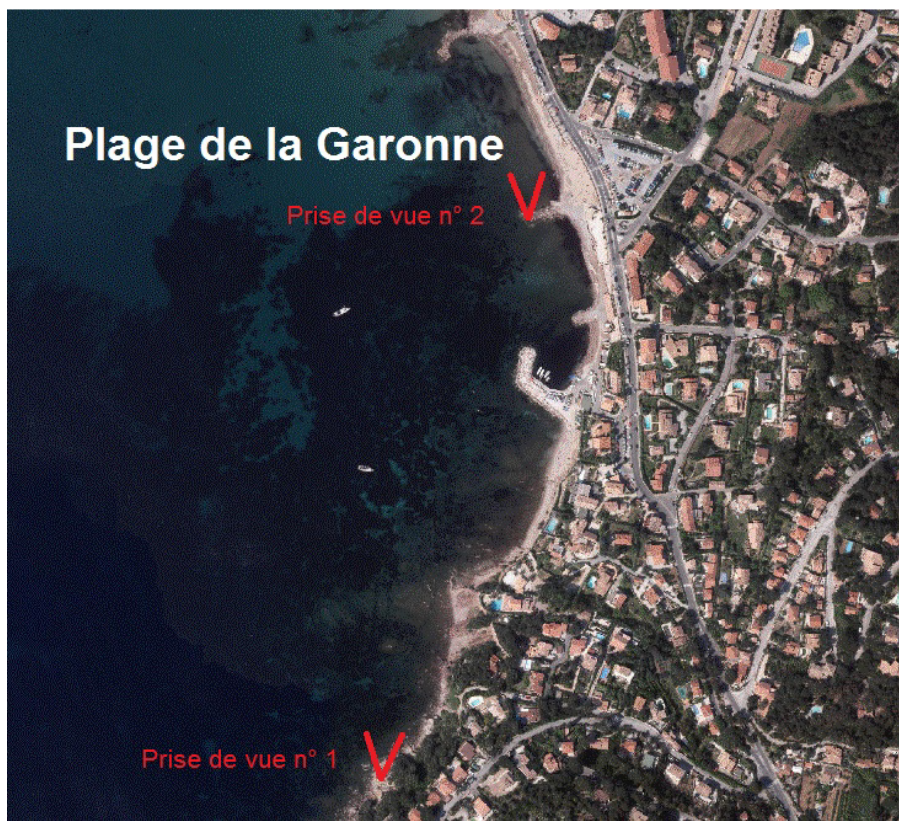
Prise de vue n° 1