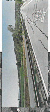
Echelle : 1:2500