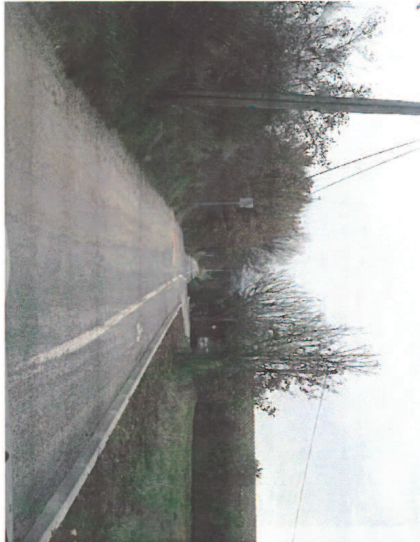
Marquage au sol