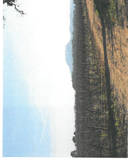
Ch d'Exploitation - Tournières en champs de vignes

Revêtement sur chemin d'exploitation Vignes entre 2.50 m et 3 m de large : 600 ml