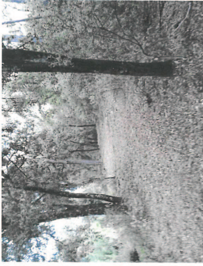
Après débroussaillage et abattage dans bois

Création Voie verte Bois et Tournières 3 m de large : 1 200 ml