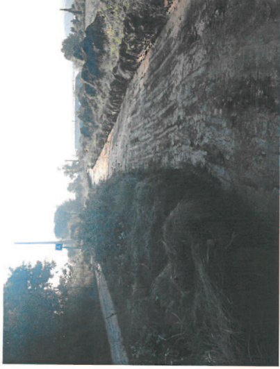
Piste Cyclable, déconnectée de la chaussée existante

Création voie verte bord de chaussée entre 2.50 et 3 de large : 300 ml