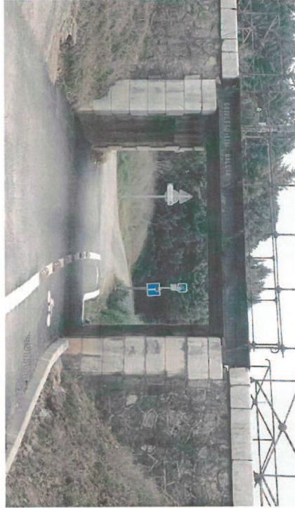
Marquage au sol, barrette à effet sonore, panneaux