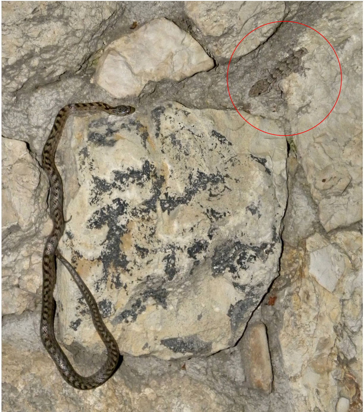
Figure 6 : Coronella girondica Daudin, 1803, s'appêtant à prédater un adulte de Tarentola mauritanica (Linnaeus, 1758), ayant déjà perdu sa queue (cerclé en rouge). Colline du Château, Nice, Alpes-Maritimes.

Protection : internationale : Convention de Berne, annexe III. Nationale : Arrêté du 19 novembre 2007, article 3.