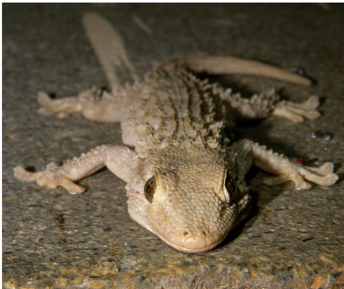
Figure 2 : Tarentola mauritanica (Linnaeus, 1758), Colline du Château, Nice, Alpes-Maritimes.

Observations sur le site : au total, 49 individus (19 adultes, 11 subadultes et 19 juvéniles) ont été recensés en 30 contacts (fig. 3), essentiellement sur des murs de pierres sèches et pierres jointées.