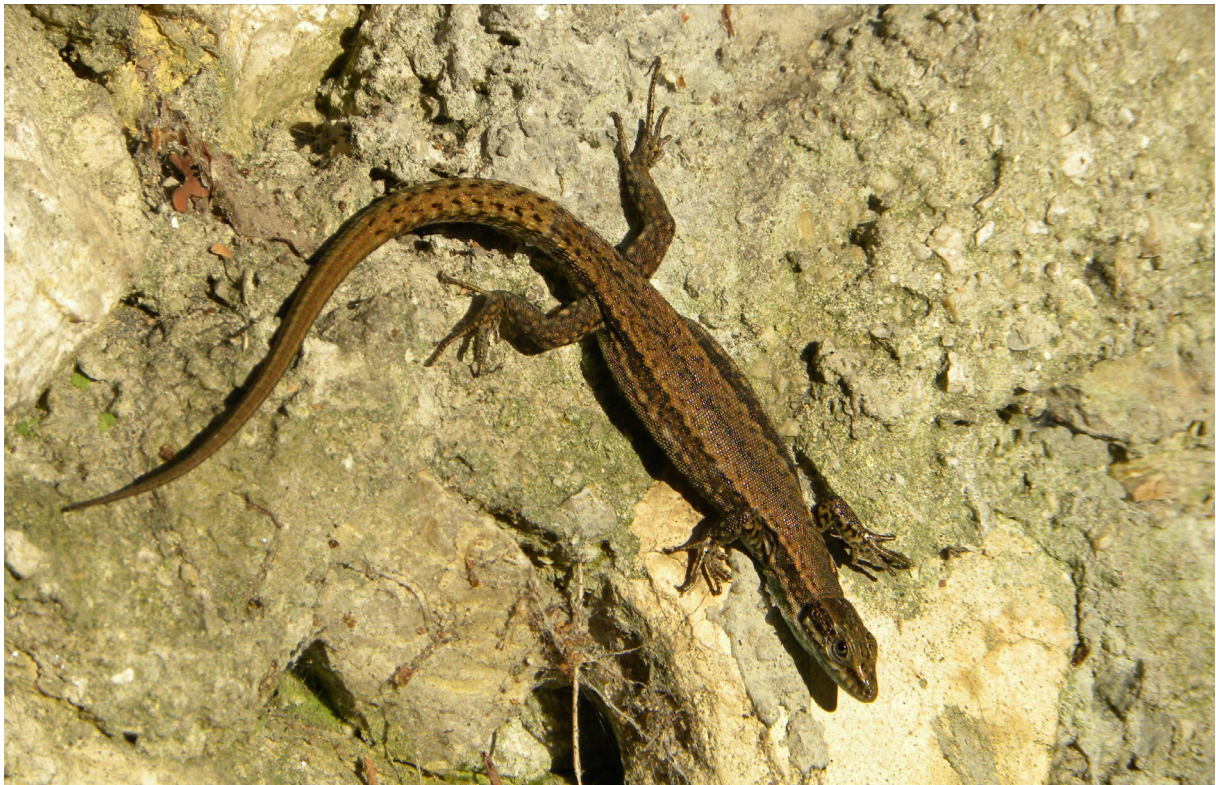
Figure 1 : Podarcis muralis (Laurenti, 1768), Colline du Château, Nice, Alpes-Maritimes.

Observation sur le site : Curieusement, bien que l'habitat paraisse particulièrement favorable, nous n'avons eu qu'un seul contact avec cette espèce, au niveau du clos de boule "Lou Bastian" le long de la montée de Montfort. Elle semble donc très rare sur la colline du château, ce qui est assez préoccupant, et pourrait bien être interprété comme un signe négatif concernant l'état écologique actuel du site.