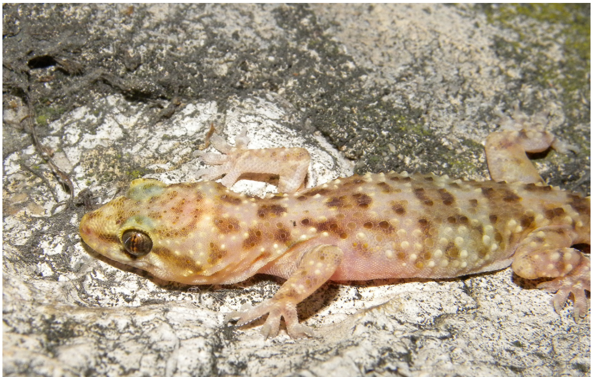
Figure 4 : Hemidactylus turcicus (Linnaeus, 1758), Colline du Château, Nice, Alpes-Maritimes.

Observations sur le site : Au total, 16 individus ont été recensés en 14 contacts (fig. 5), essentiellement sur des murs de pierres sèches et pierres jointées, dont 3 adultes, 7 subadultes et 6 juvéniles.