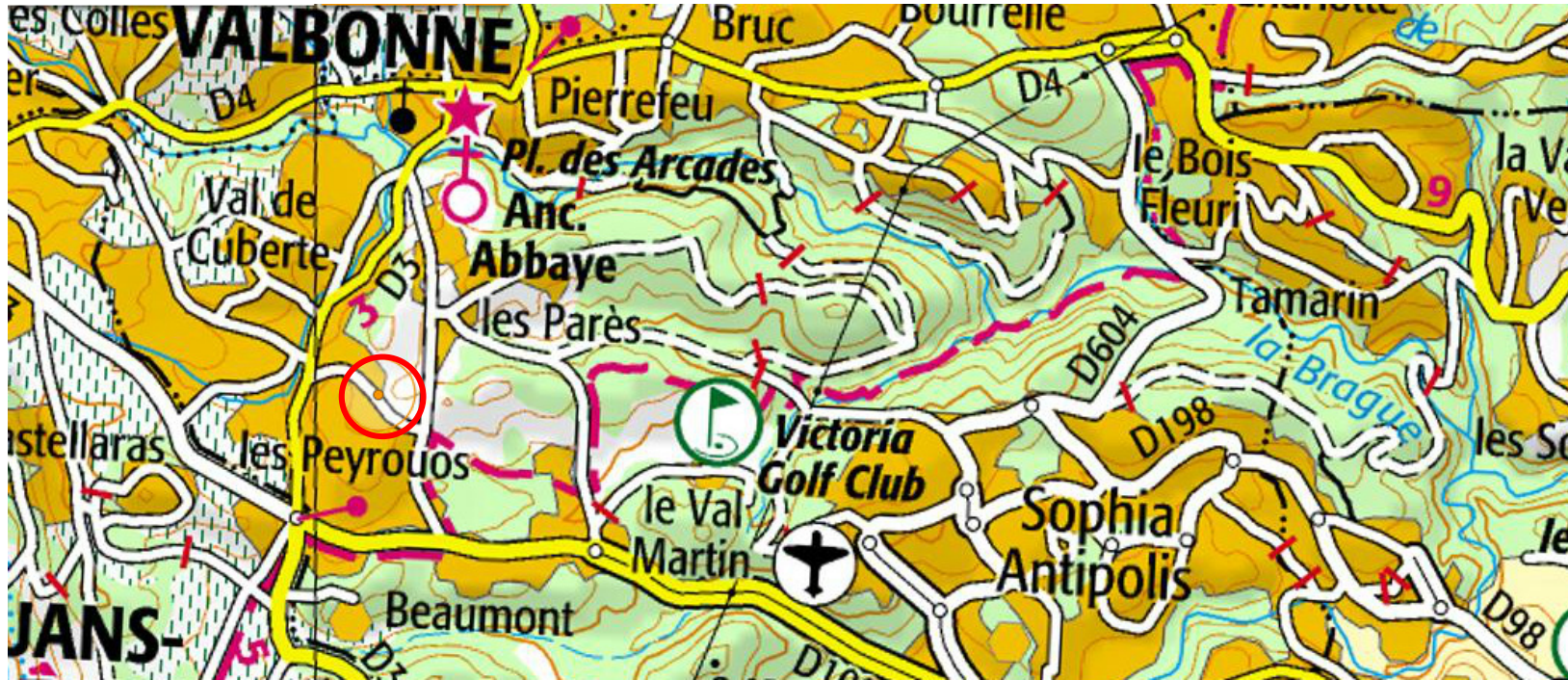
Plan de situation 1/25 000ème