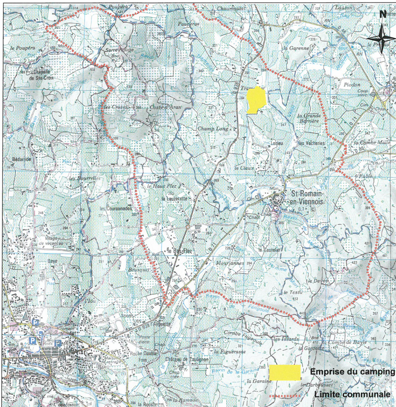
Extrait de la carte IGN TOP 25, feuille de Carpentras, n° 3040 ET au 1/25 000

L'extension prévue se situe sur les parcelles n° 1 209 et 1 215 de la section A, d'une superficie d'environ 6 863 m 2 .