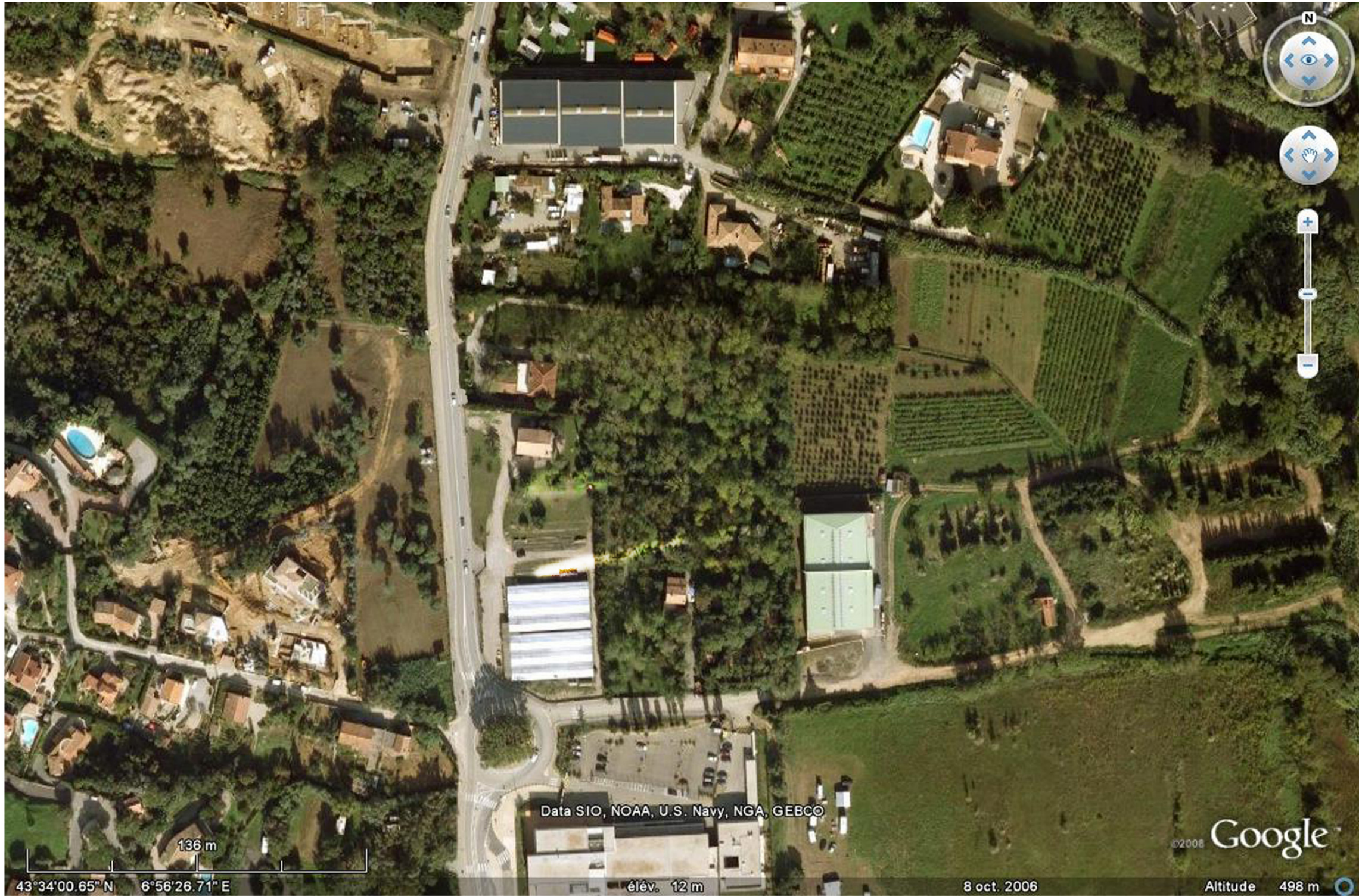
Photo aérienne Etat des lieux