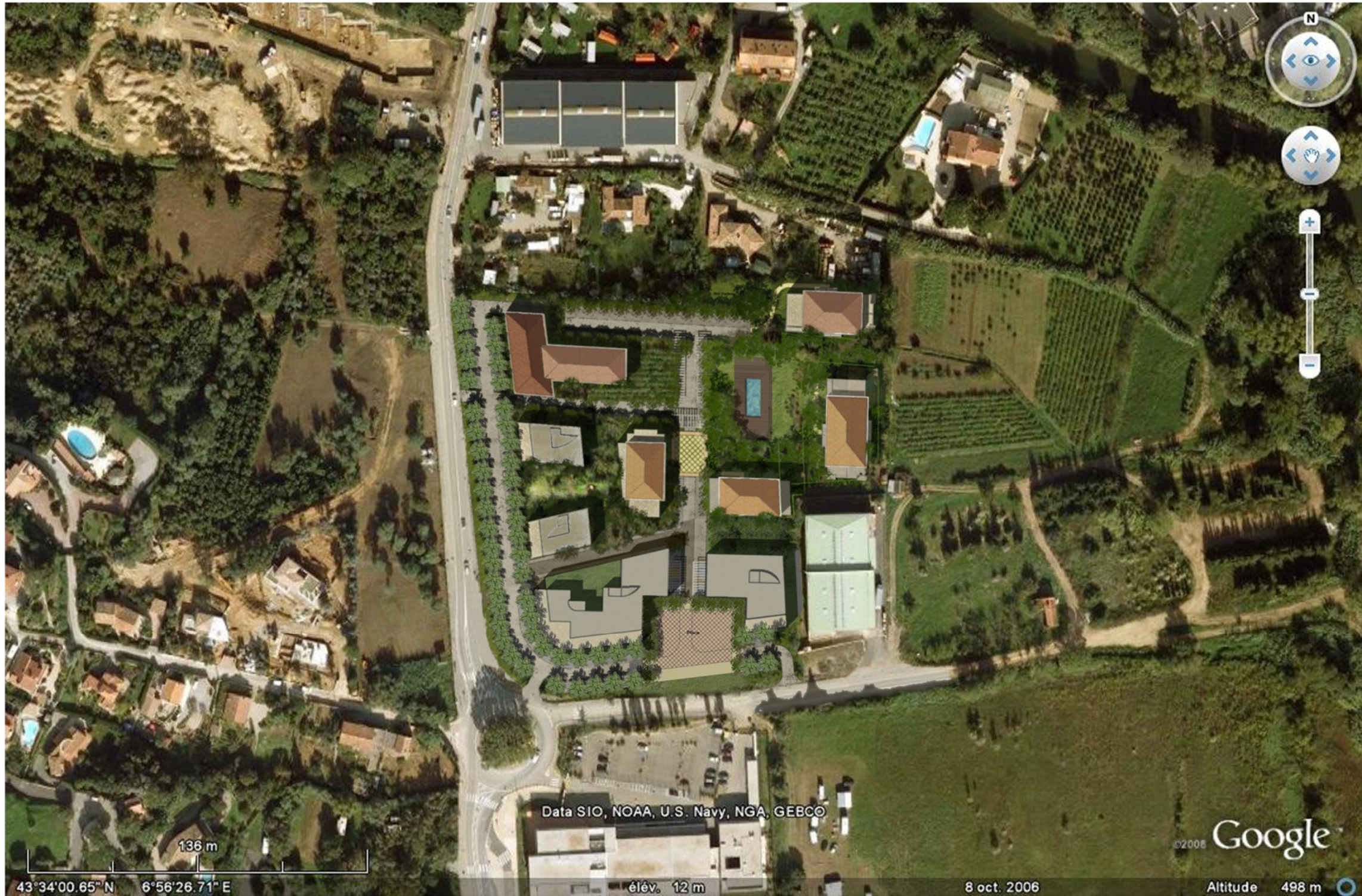
Photo aérienne Photomontage