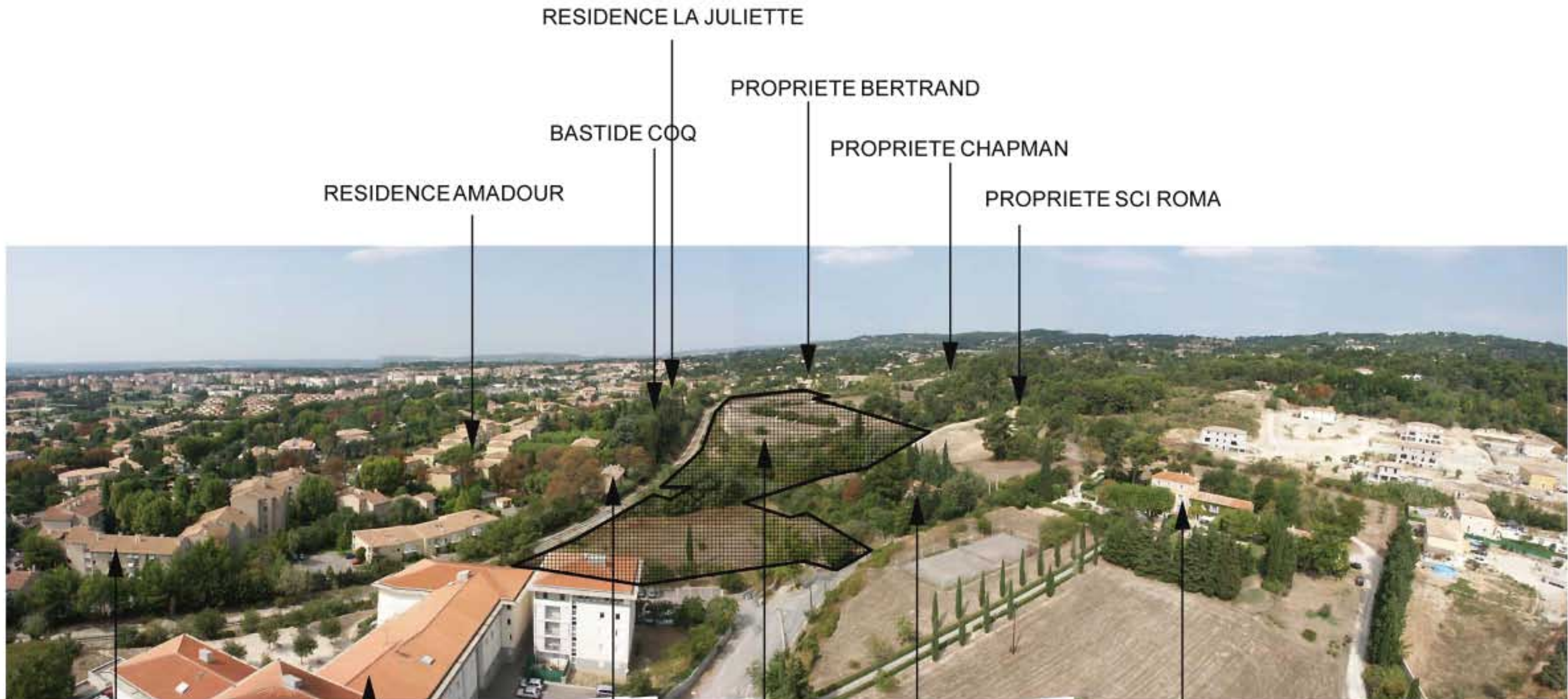
Photographie de septembre 2006