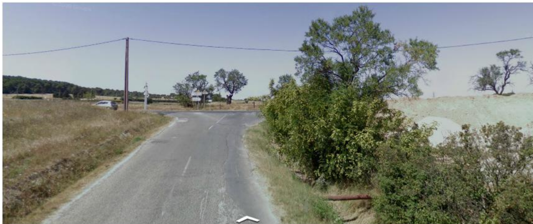
Vue depuis la RD60a