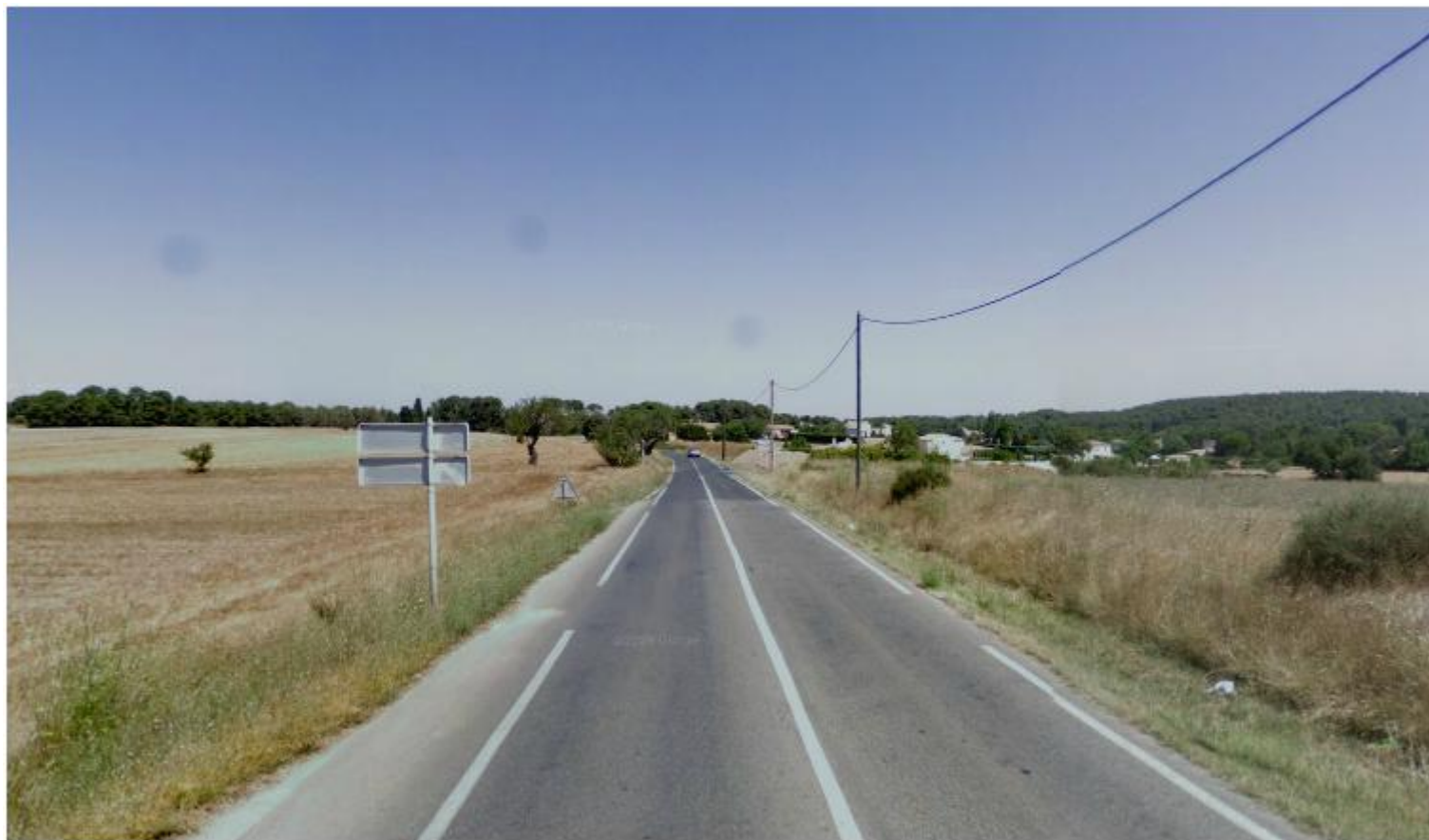
Vue depuis l'arrivée de Plan de Campagne