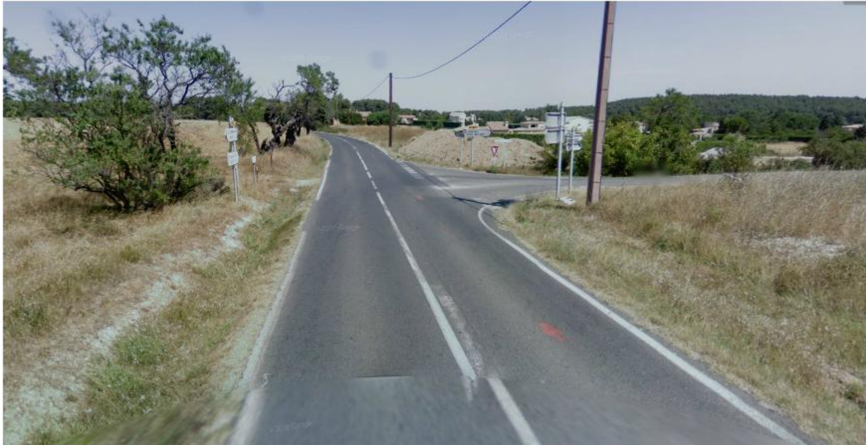
Vue du carrefour avec la RD60a depuis l'arrivée de Plan de Campagne