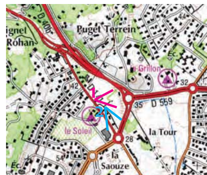
Localisation des prises de vue