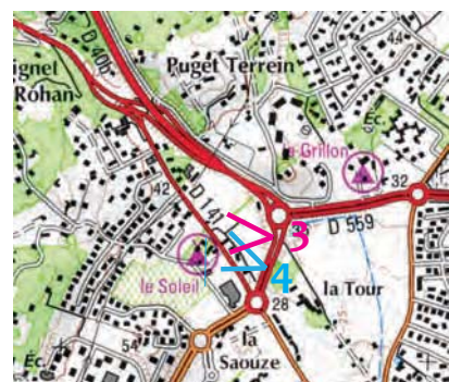
Localisation des prises de vue