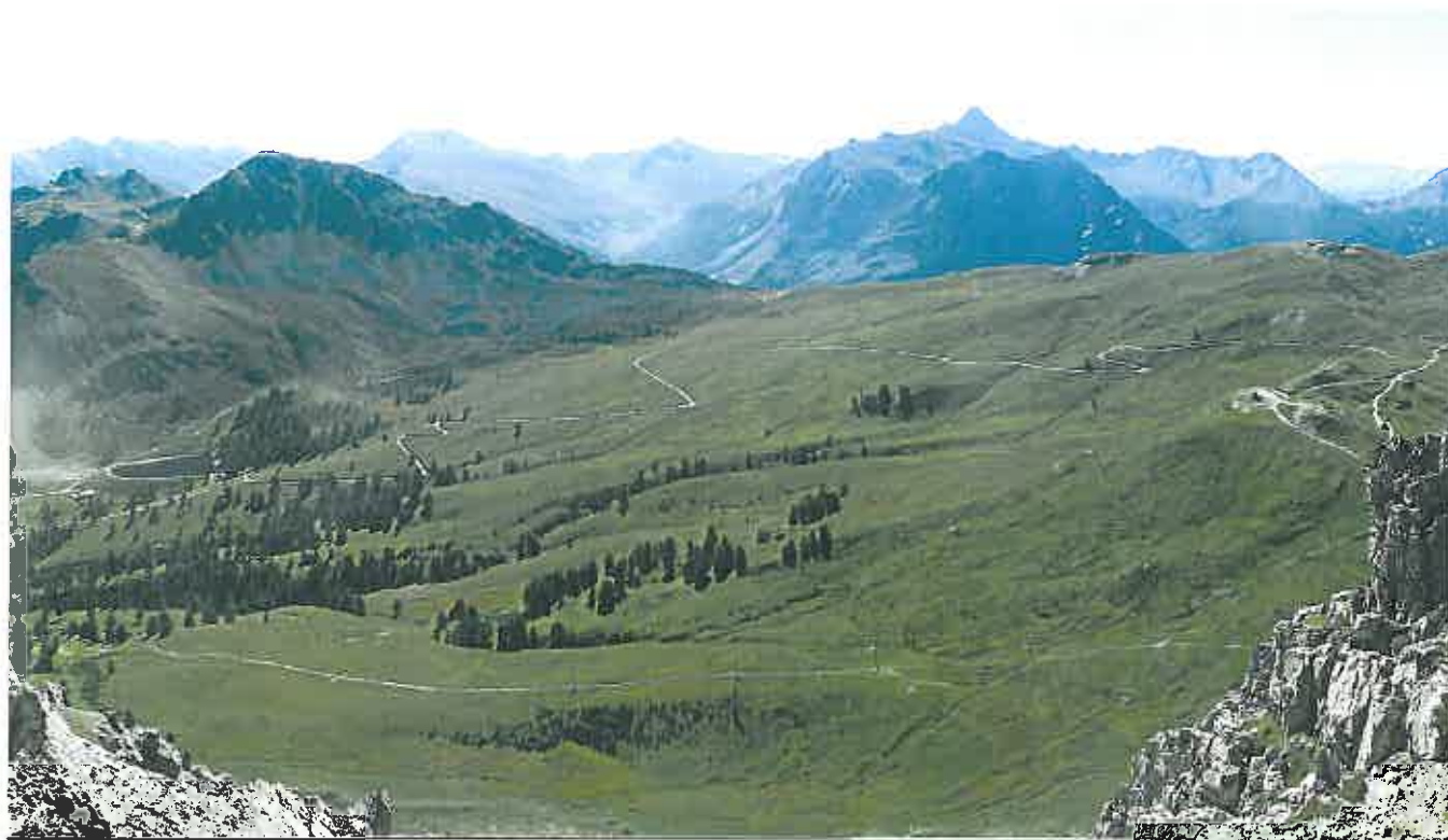
Photo 1 vue d'ensemble