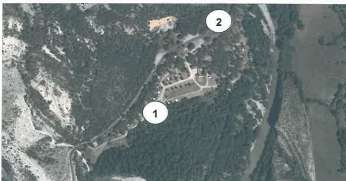
Localisation des prises de vues sur fond de Orthophoto 2011 :

1 – photo prise en octobre 2013 à l'intérieur du camping