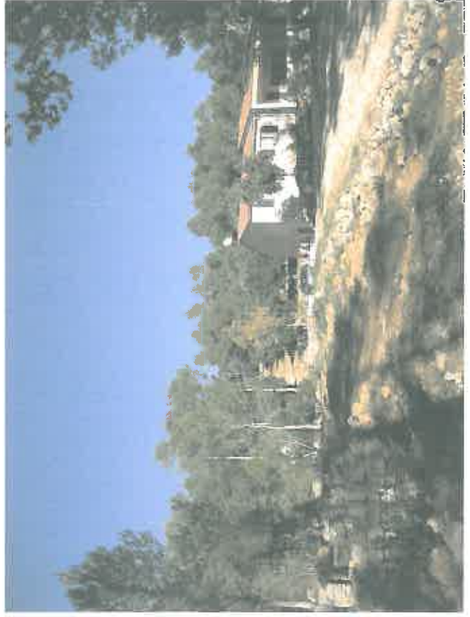
VUE 2 - prise le 1er avril 2014