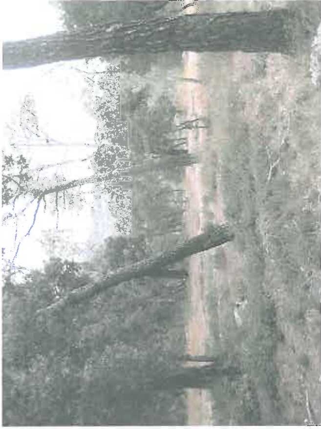
VUE 1 - prise le 1er avril 2014