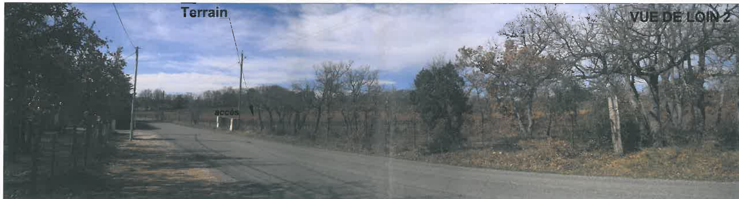
Date : 05/03/2014