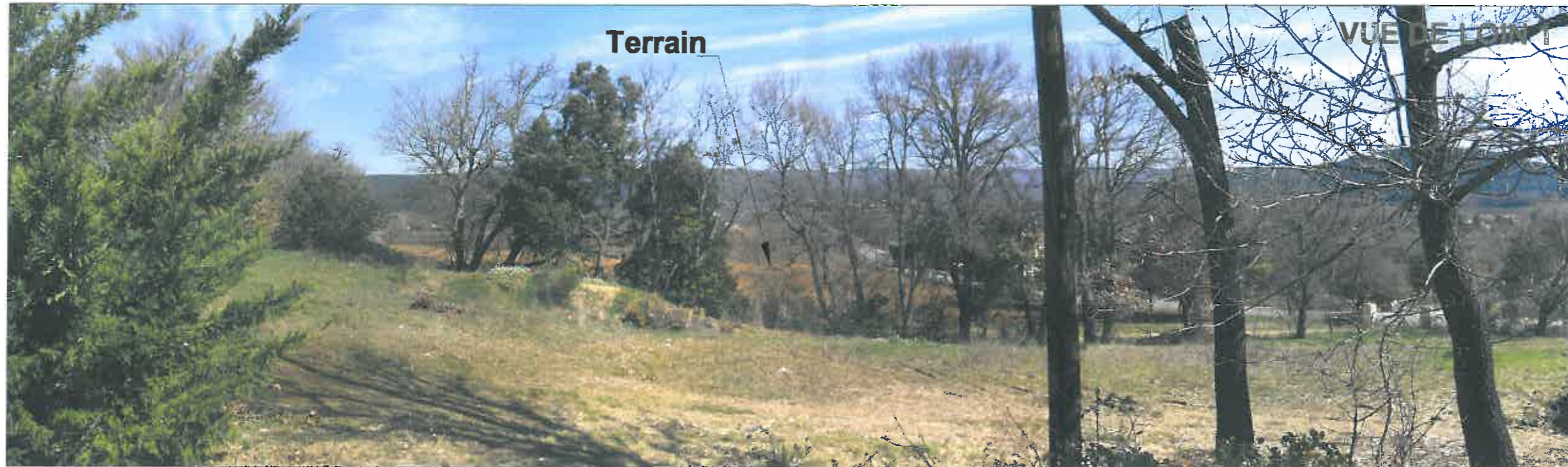
Date : 05/03/2014