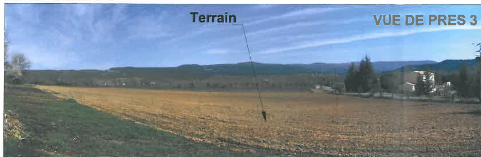
Date : 05/03/2014