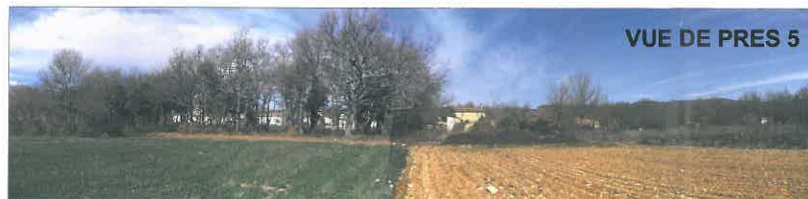
Date : 05/03/2014