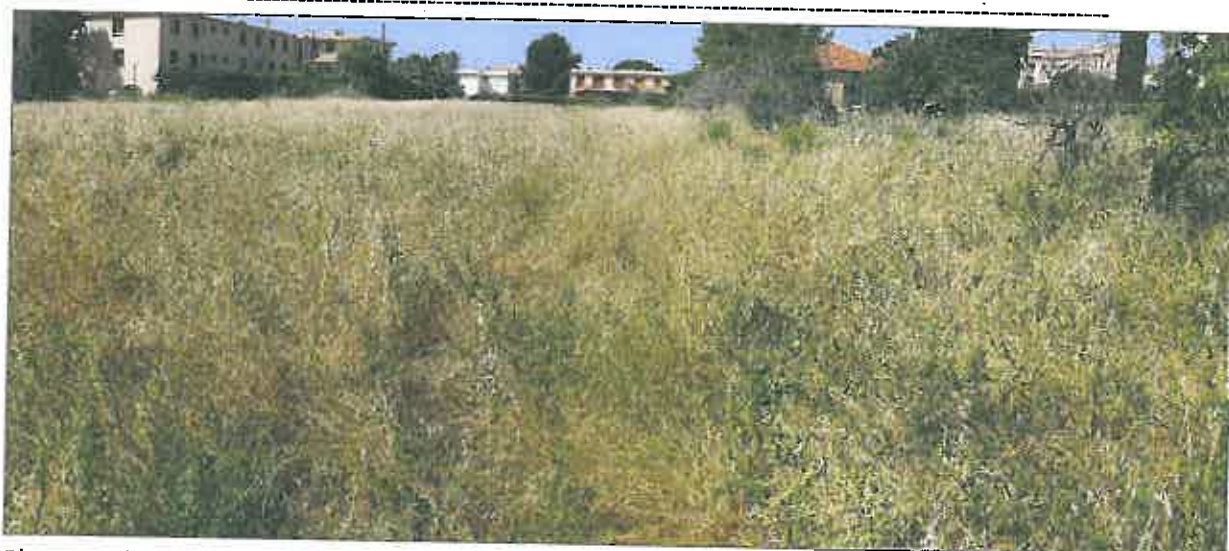
Photographie 1 : Vue de la friche post-culturelle

Sous la dominance de cette haute Graminée se rencontrent quelques Fabacées reliques de certaines pratiques culturales (enrichissement des sols des jachères) : Luzernes ( Medicago sp. ), Mèlilots ( Melilotus sp. ), Gesses ( Lathyrus sp. )... accompagnés du Liseron des champs ( Convolvulus arvensis ) et du Plantain lancéolé ( Plantago lanceolata ), classiques de ce type de milieu.