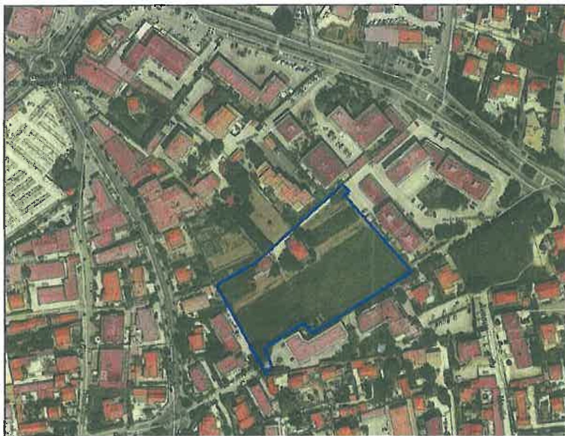
Carte 3 : Localisation du projet sur photographie aérienne