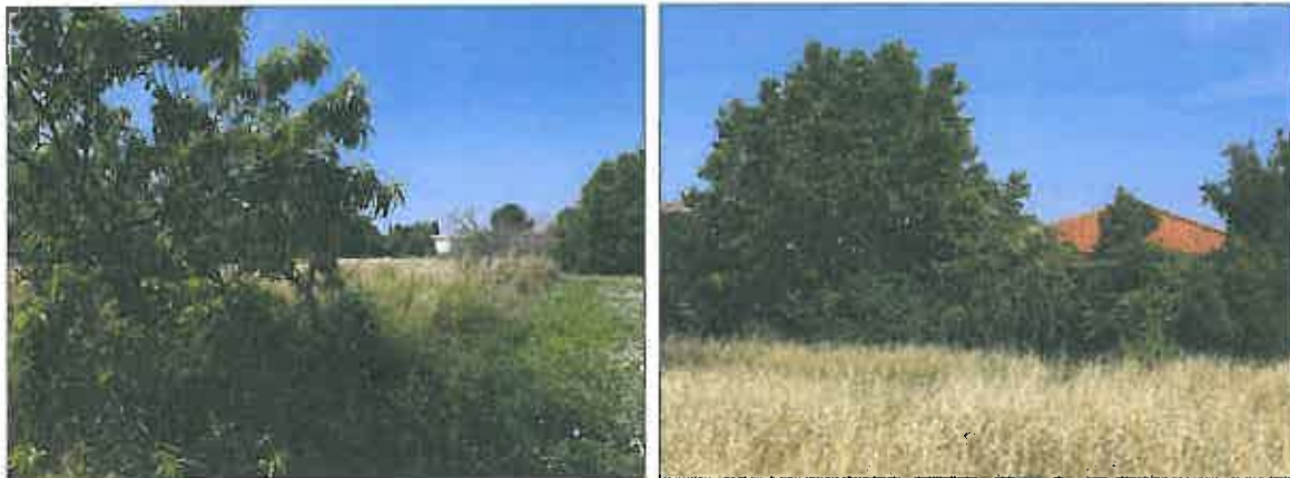
Photographie 3 : Cerasier (à gauche) et arbres d'ornement autour du bâti (à droite)