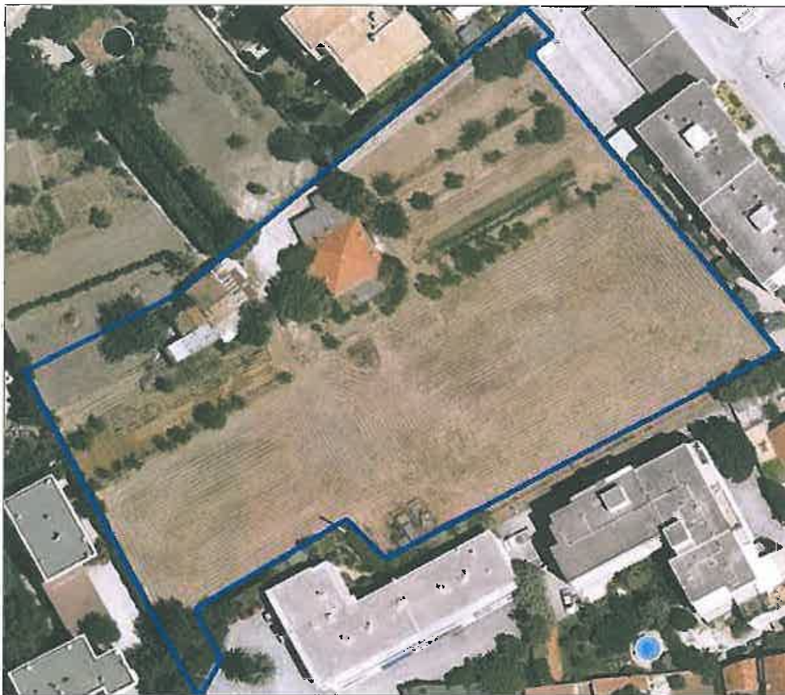
Carte 7 : Vue aérienne de la propriété le 13 juillet 2007