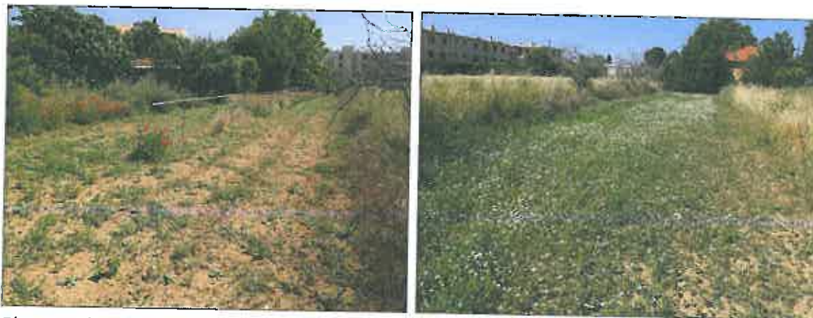
Photographie 2 : Vues de deux secteurs potagers

Le jardin potager est actuellement au repos à l'exception d'une petite partie où la terre vient d'être retournée et arrosée. Les autres portions sont envahies par la Fausse Roquette ( Diplotaxis erucoïdes ) ou présentent quelques reliques maraîchères (salades, artichauts...) ainsi que quelques touffes de Coquelicots ( Papaver rhoeas ).