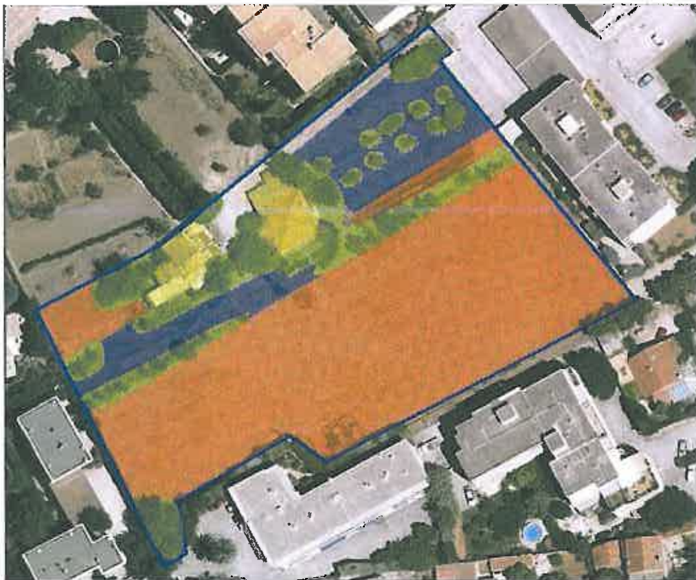
Carte 5 : répartition des trois grands types de milieux sur la propriété étudiée

La photo aérienne suivante matérialise la répartition des trois grands types de milieux sur la propriété étudiée et montre bien la dominance des secteurs en friche :