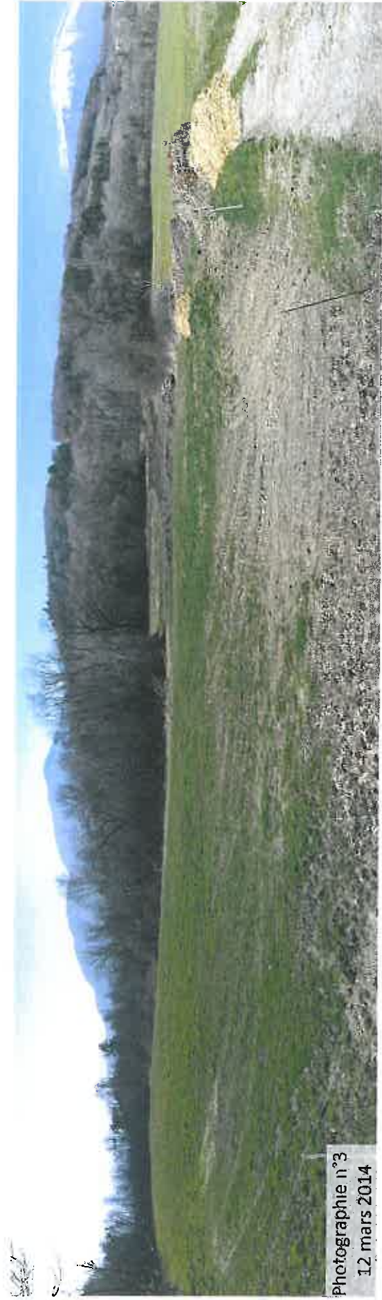
Photographie n°3 12 mars 2014