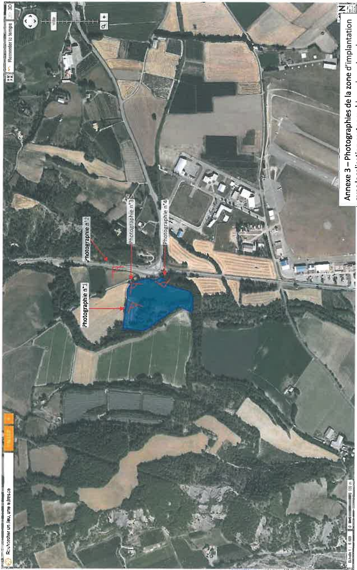
Annexe 3 – Photographies de la zone d’implantation avec localisation cartographique des prises de vue