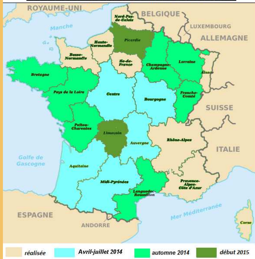
Calendriers prévisionnels pour les consultations sur le projet de SRCE