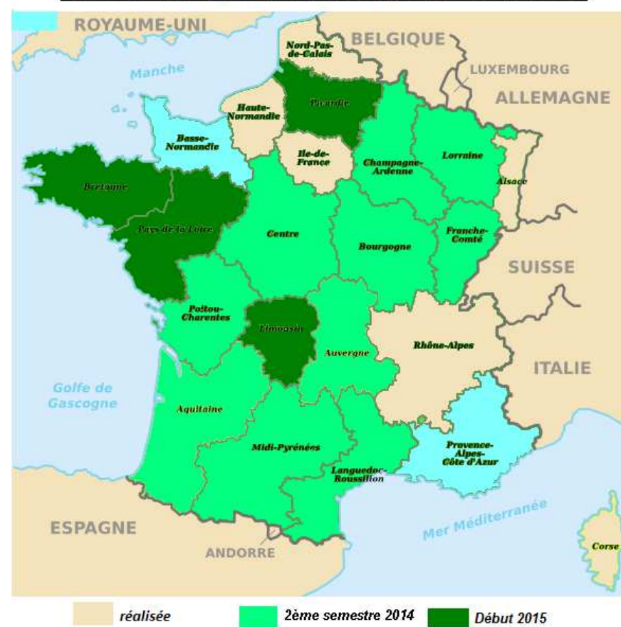
Calendriers prévisionnels pour l'enquête publique sur le projet de SRCE