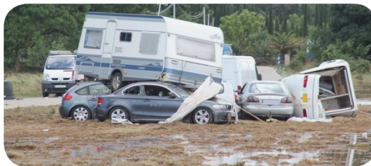
2010 Roquebrune