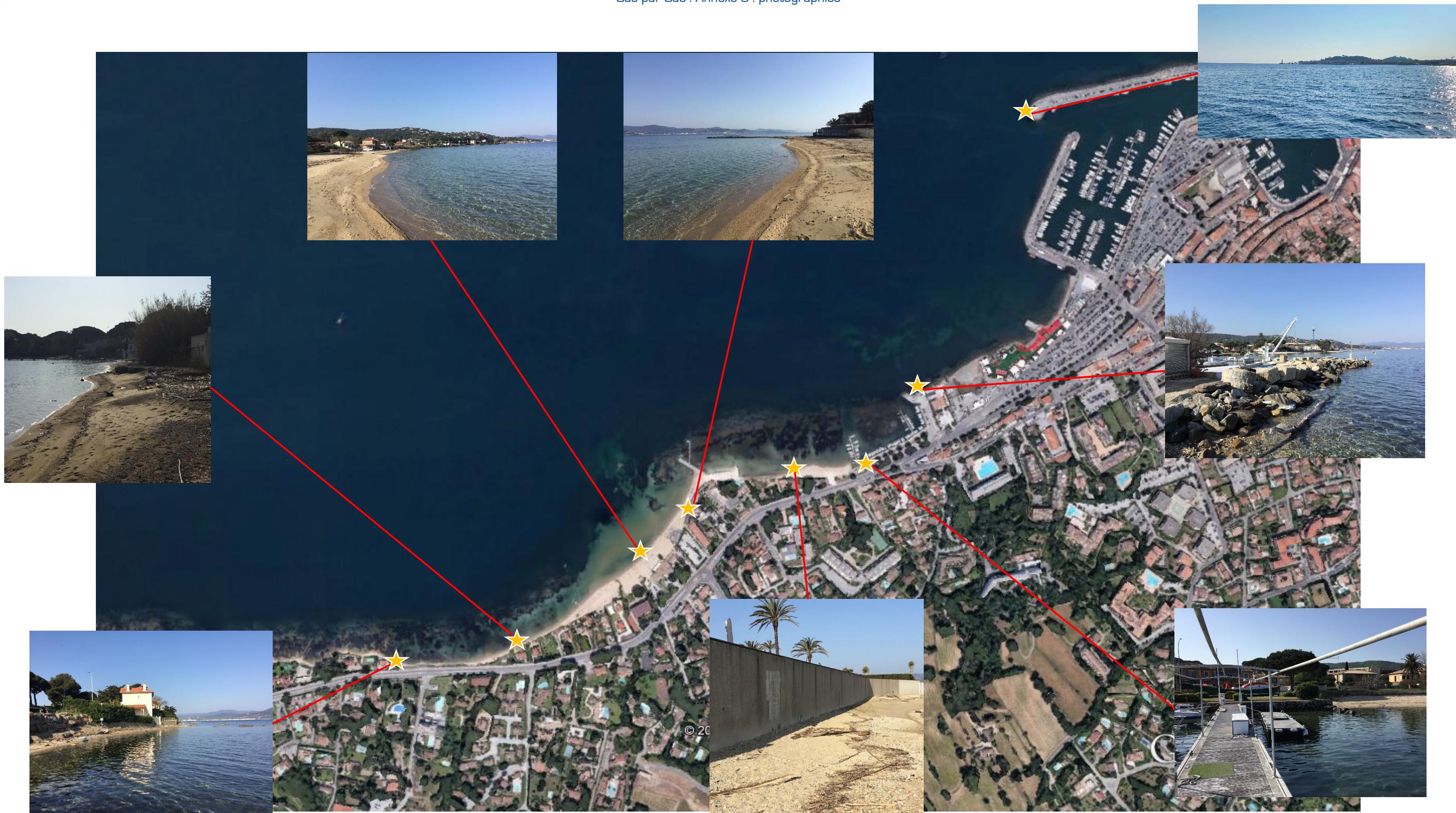
Figure 1 : Localisation de l'environnement et des paysages autour de la zone de projet, Images satellite avril 2016