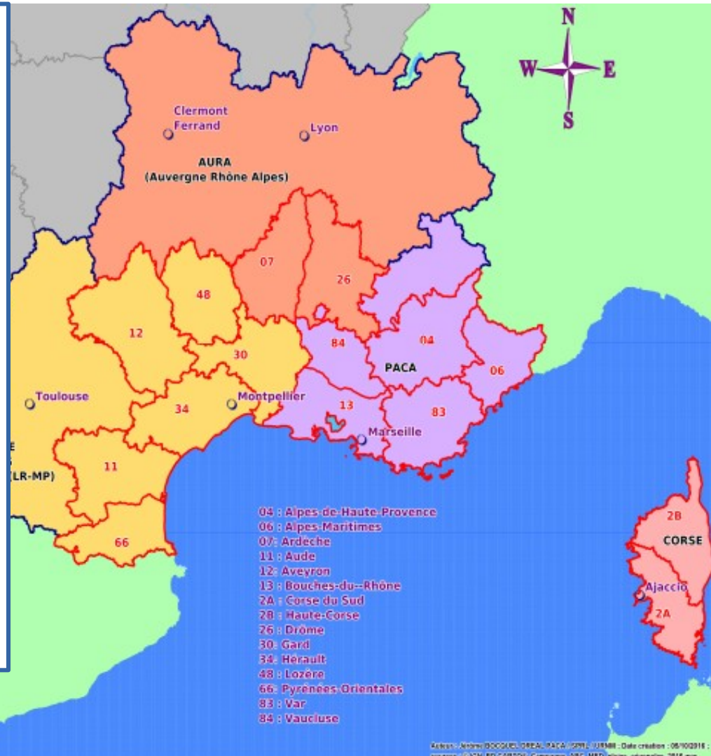
Territories concerned by The national campaigns of sensibilisation