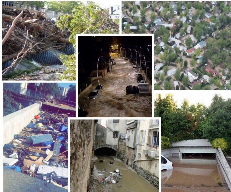
Floodings October 3rd 2015 in the Alpes Maritimes

Creation of an interregional cooperation