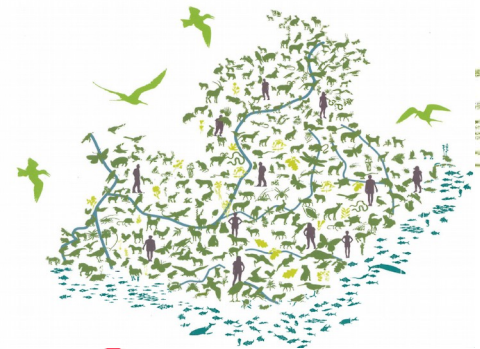
Schéma Régional de Cohérence Ecologique