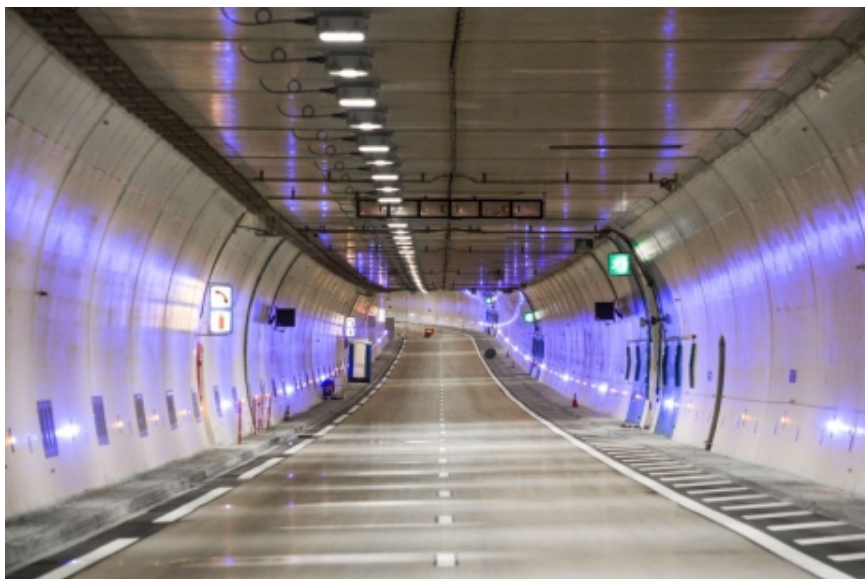
Tunnel de Toulon - Tube Sud