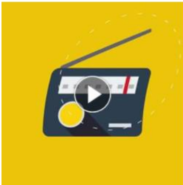
Pluie-inondation Plus d'informations en ligne EN SAVOIR PLUS