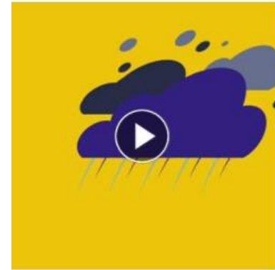
Pluie-inondation Adoptez les bons comporte... EN SAVOIR PLUS