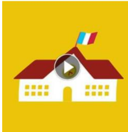
Pluie-inondation Plus d'informations en ligne EN SAVOIR PLUS