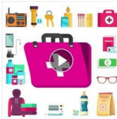
Pluie-inondation Plus d'informations en ligne EN SAVOIR PLUS