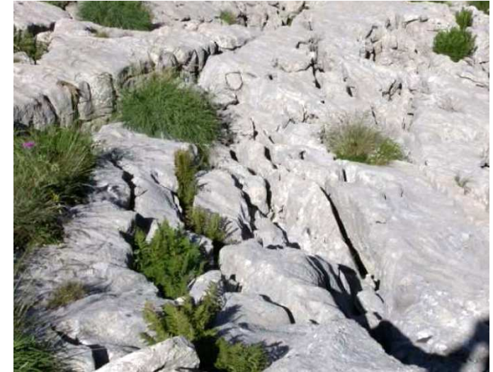
Végétation installée dans les anfractuosités d'un lapiéz