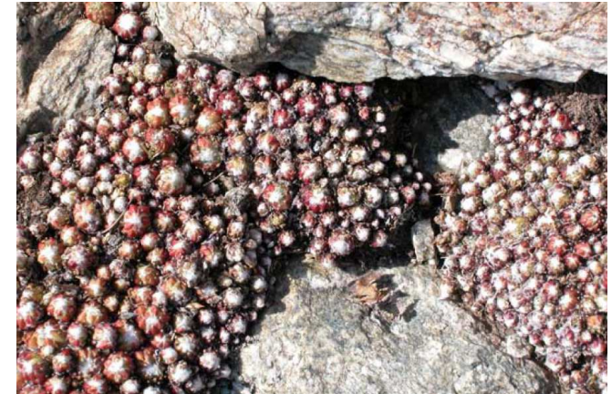
Joubarbe dans des anfractuosités rocheuses