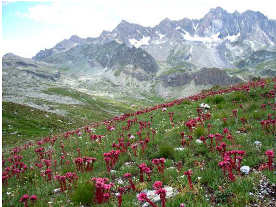
Petites taches de végétation pionnière à Joubarbes des montagnes sur lithosols en mosaïque avec les pelouses acides