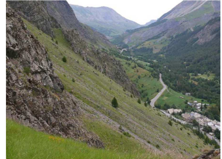
Éboulis siliceux xéro-thermophiles dans les Hautes-Alpes