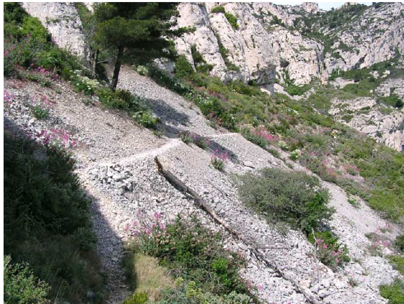
Éboulis calcaire dans les calanques, habitat de la Sabline de Provence