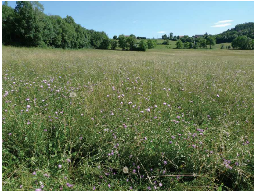
Prairie à Serratula lycopifolia