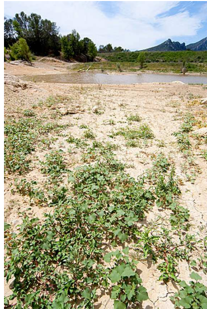
Bidention des rivières et Chenopodium rubri à Xanthium, Gard