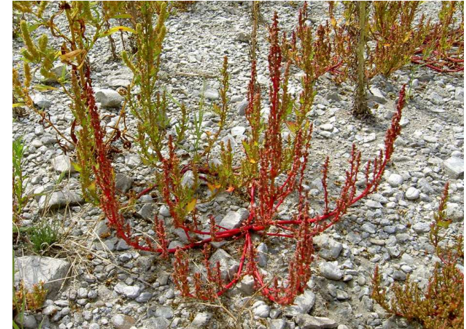
Chenopodium rubrum