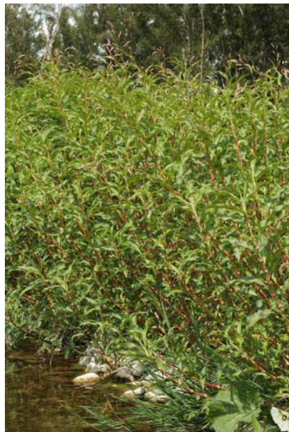
Faciès très luxuriant dominés par la Renouée à feuilles de patience