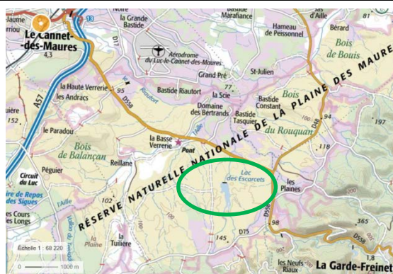
Localisation du secteur objet de la mesure proposée