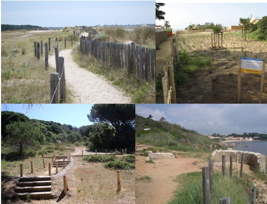
Exemples de mise en défends