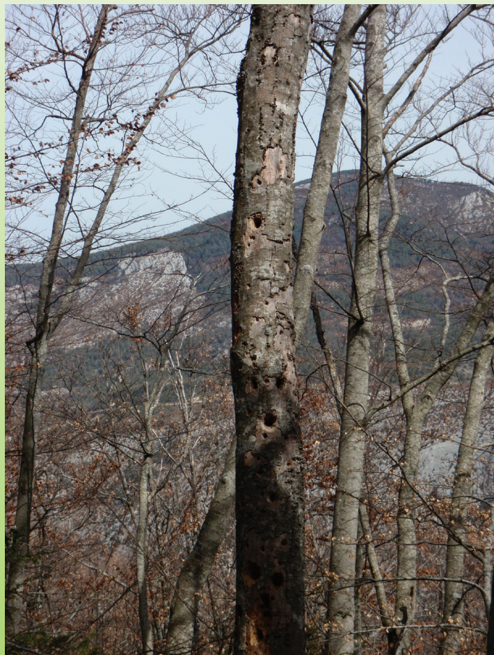
Arbres morts à cavités dans la future réserve biologique d'Aiguines

* Ont fusionné dans la CFT réserve de biosphère Luberon – Lure