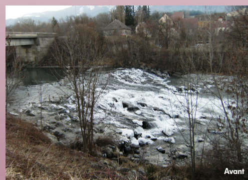
Ouvrage sur le Drac - Saint-Bonnet (Hautes-Alpes)