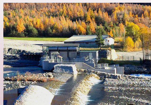
Passerelle pour la protection des aprons sur la Duranc - Peipin (Alpes de Haute Provence)