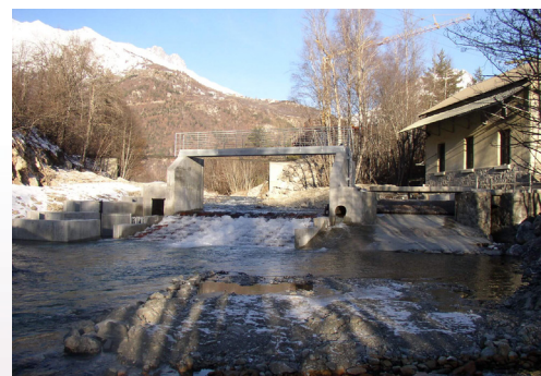
Ouvrage sur le Drac - Pont-du-Fossé (Hautes-Alpes)