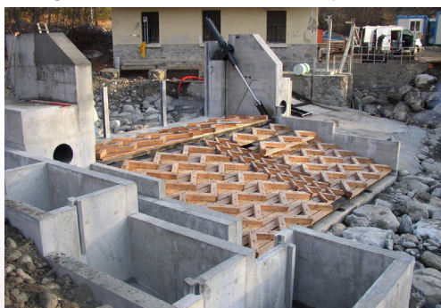
Ouvrage sur le Drac - Vallouise (Hautes-Alpes)